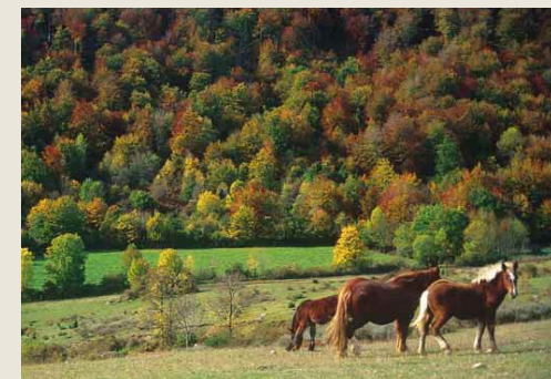
Zaldiak San Cristóbal mendiko maldan

Herrirako sarbidean dagoen bidegurutzean eskuinera jo behar da. Ezkerreko kale-buru bat atzean utzita eta Biarra erreka gurutzatu ondoren, bidea legarrezko pista bihurtzen da berriro ere. Albo batean antzinako iturri-harraska-uraska kokaturik dago.